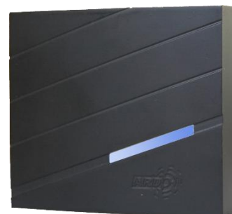
Version extérieure, anti-vandale

Une configuration anti-vandale bi-fréquence 13,56 Mhz / EM 125KHz complète la gamme ( réf. F30207 ).