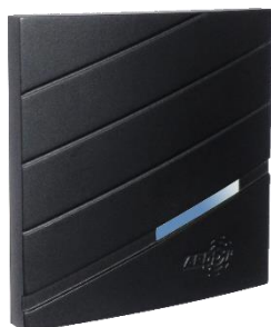
Version intérieure encastrée