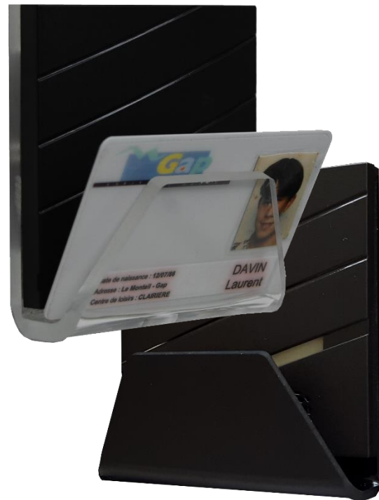
Économiseur énergie avec support carte transparent ou noir au choix

En version connectée , il fait partie du réseau de lecteurs de badge gérés par un contrôleur OTES 2 dans une installation de contrôle d'accès. Le mode connecté apporte davantage de réactivité dans la mise à jour des droits d'accès aux fonctions électriques du local ainsi qu'en cas de perte de badge. Le contrôleur OTES 2 peut délivrer 2 contacts secs indépendants activables selon le profil du titulaire de la carte, par exemple : le badge du technicien de surface activera les prises de courant et l'éclairage, celui du titulaire de la activera toutes les fonctions électriques.