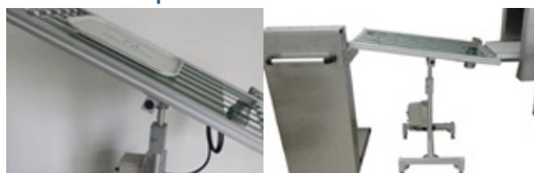
Élévateur de plateaux

Le chariot du DP5 en exploitation avec la « Split Machine » du fabricant de matériels de laverie et de cuisine pour la restauration collective HOBART