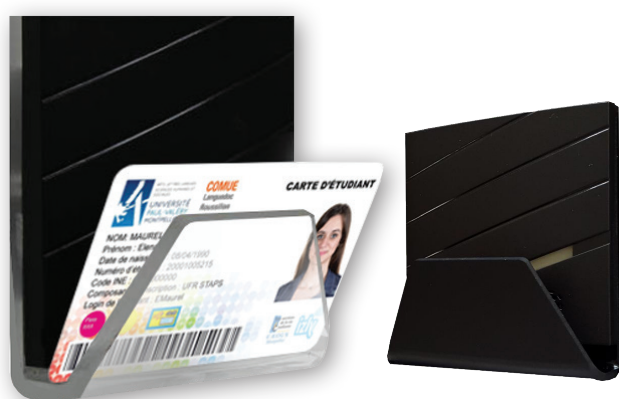
Économiseur d'énergie avec support carte transparent ou noir

En version connectée, il fait partie du réseau de lecteurs de badge gérés par un contrôleur OTES II dans une installation de contrôle d'accès. Le mode connecté apporte davantage de réactivité dans la mise à jour des droits d'accès aux fonctions électriques du local ainsi qu'en cas de perte de badge. Le contrôleur OTES II peut délivrer 2 contacts secs indépendants activables selon le profil du titulaire de la carte, par exemple : le badge du technicien de surface activera les prises de courant et l'éclairage, celui du titulaire de la chambre activera toutes les fonctions électriques.